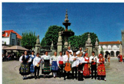
Grupo de Cordas