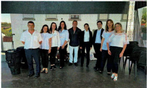
Escola de Música